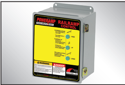
Los botones de presión constante de elevación, bajada y reborde proporcionan un control continuo al operador.