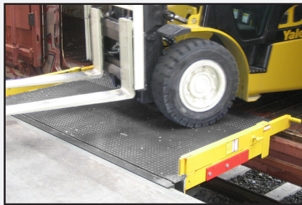
Protecciones contra descarrilamiento amarillas estándar para evitar que un montacargas salga del borde.