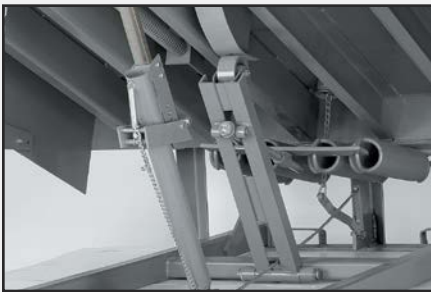
El conjunto equilibrador Cam Control permite que la rampa se extienda suavemente y que el nivelador baje fácilmente.