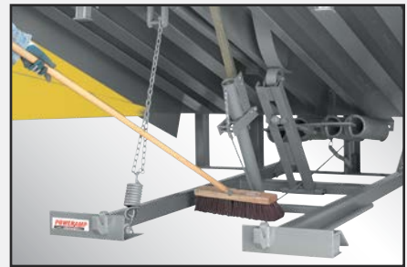
CleanSweep Frame permite un acceso despejado al área del pozo.