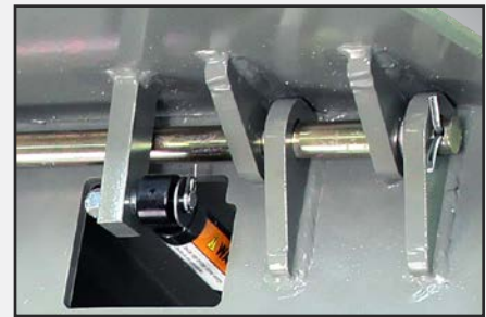
Plataforma de "construcción de caja" con un diseño de bisagra tipo orejeta para servicio pesado.