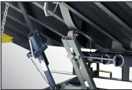
El conjunto equilibrador Cam Control permite que la rampa se extienda suavemente y que el nivelador baje fácilmente.