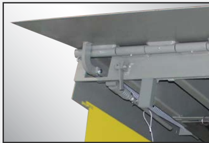
Mecanismo único de enganche de reborde que proporciona una extensión positiva y de altura completa del reborde.