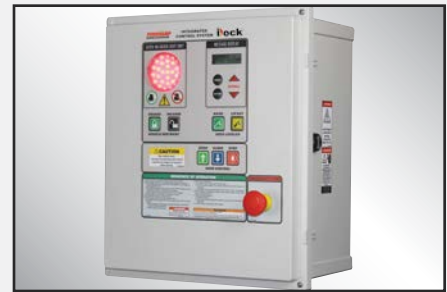
Puntal de mantenimiento con bloqueo y etiquetado, y puntal de apoyo del reborde.