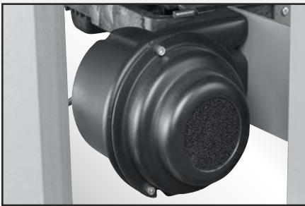
Ventilador de aire de gran volumen y baja presión para elevar de forma eficiente el nivelador.