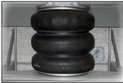
Accesorios de conexión rápida para una instalación simple.