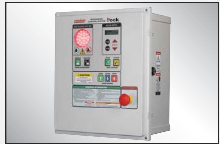
El sistema de fuelle de hule con correa de acero utiliza aire comprimido para elevar la plataforma.