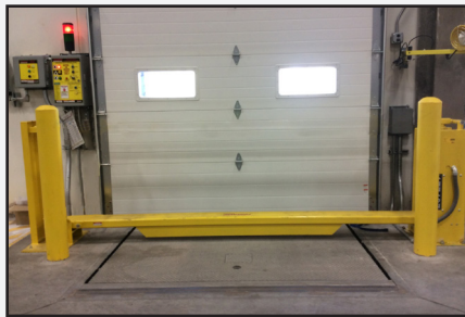
Protección contra colisiones para cortina metálica.