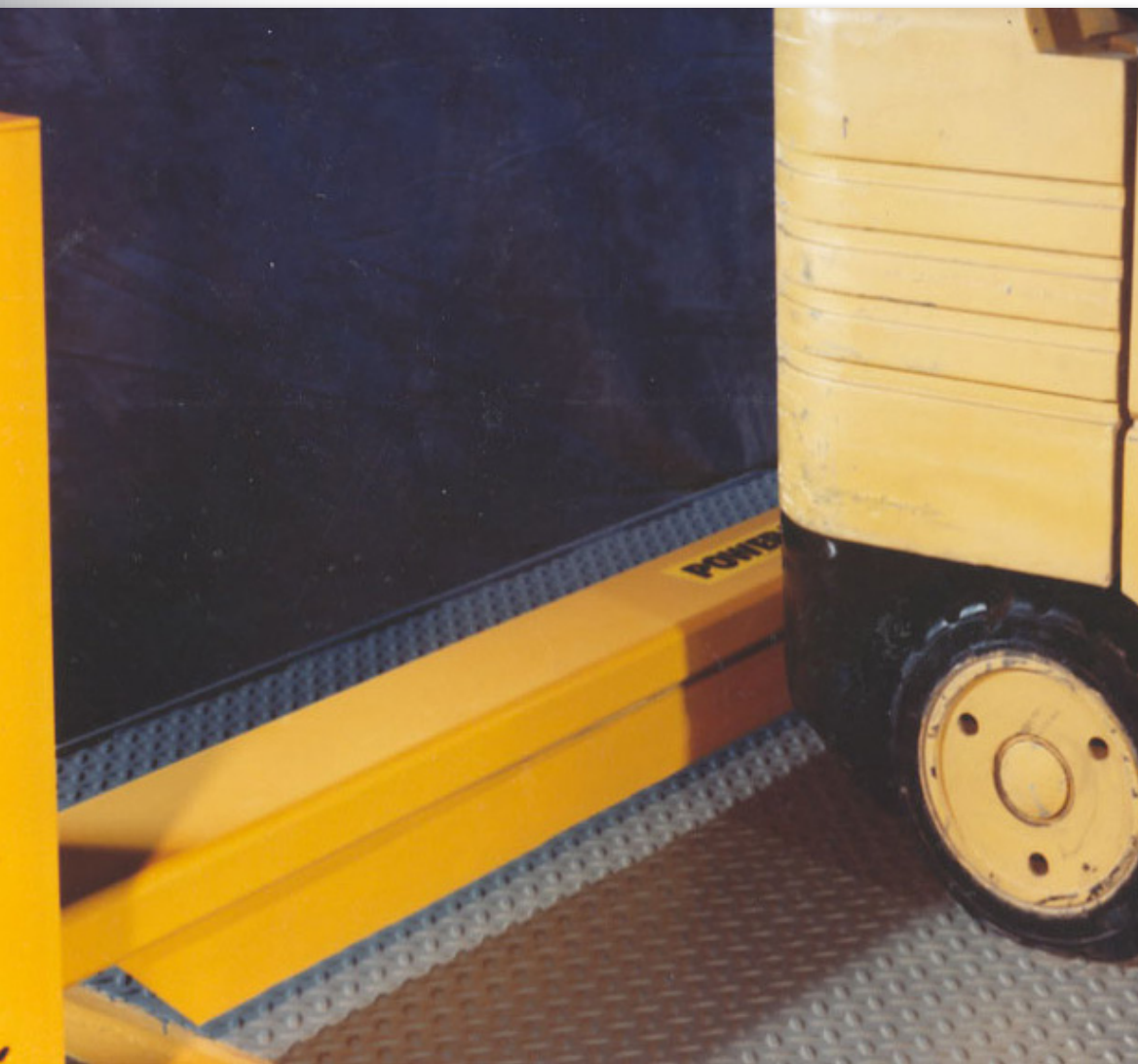
Se muestra barrera de elevación de barra