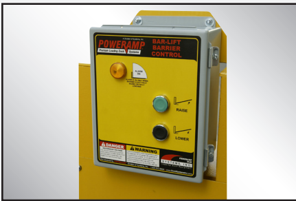
Con capacidad para interbloqueo con cortina, nivelador, retenedor y otros elementos motorizados en el muelle/andén.